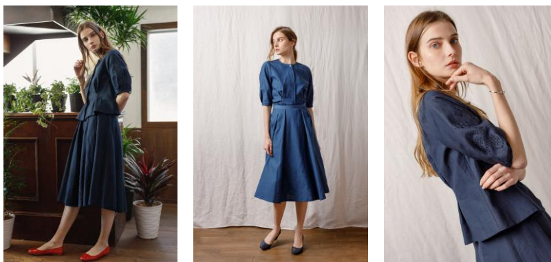
<発売中>リネンカットワーク刺繍セットアップ

https://store.nestrobe.com/highgrove/itemdetail?ItemID=500211-0001&sci=2