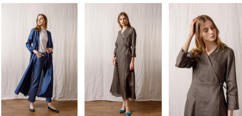
<予約販売受付中>リネンカシュクールフレアマキシワンピース

https://store.nestrobe.com/highgrove/itemdetail?ItemID=500211-0005&sci=22