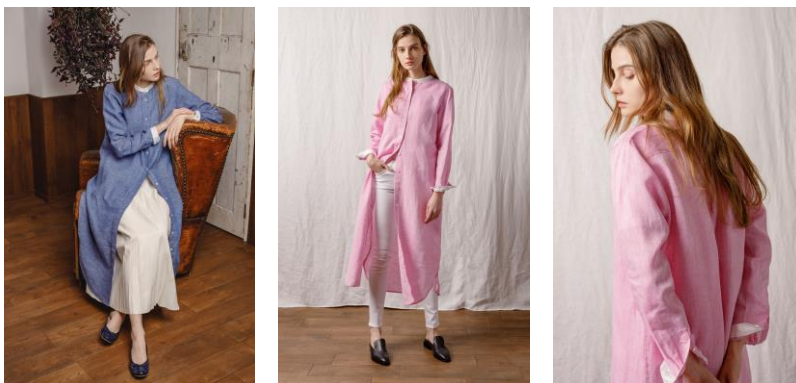
<発売中>ハードマンズリネン クレリックシャツワンピース

https://store.nestrobe.com/highgrove/itemdetail?ItemID=500211-0005&sci=22