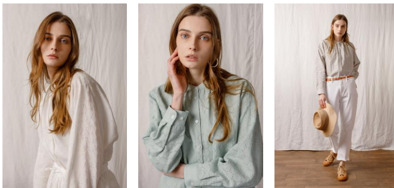
<発売中>リネン総柄エンブroidアリーブラウス

https://store.nestrobe.com/highgrove/itemdetail?ItemID=500211-0001&sci=2